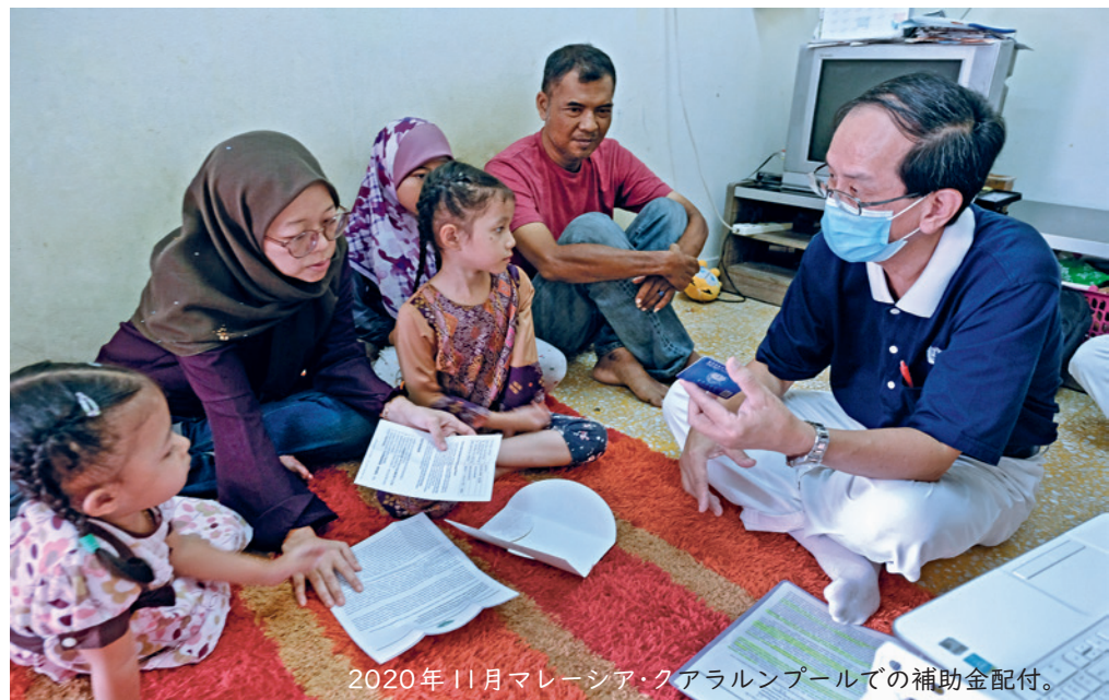
2020年11月マレーシア・クアラルンプールでの補助金配付。