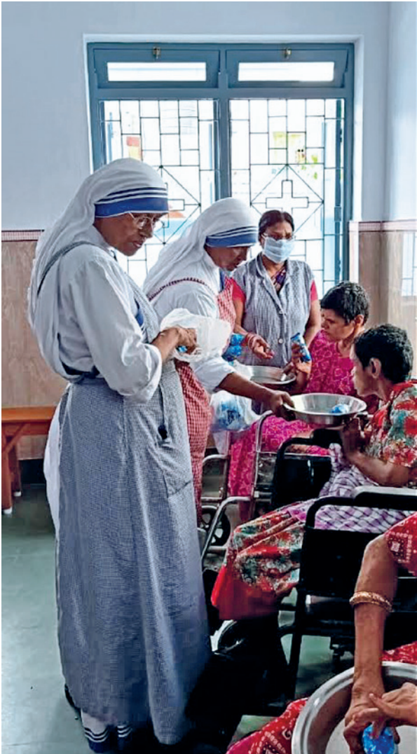
●路上や村々で配付する修道女たちは、家も身寄りもない病人たちを見つけると、まずは新型コロナウイルスに罹っていないことを確かめた後、修道院に連れ帰ってケアをする。

力したところのある人道組織や医療機関などと連携を考えるべきだと言った。そこで、フランスに本部を置く世界医師会（MDM）を通じて、南スーダン、ベナン、イラク、マダガスカルなど二十六カ国に物資を届けた。国連難民高等弁務室と長年、協力関係にあるタイとマレーシアの慈済ボランティアのおかげで、愛の道が切り開かれた。このような非常事態には、自他の分け隔てなく、宗教を越えて協力することが必要だ。