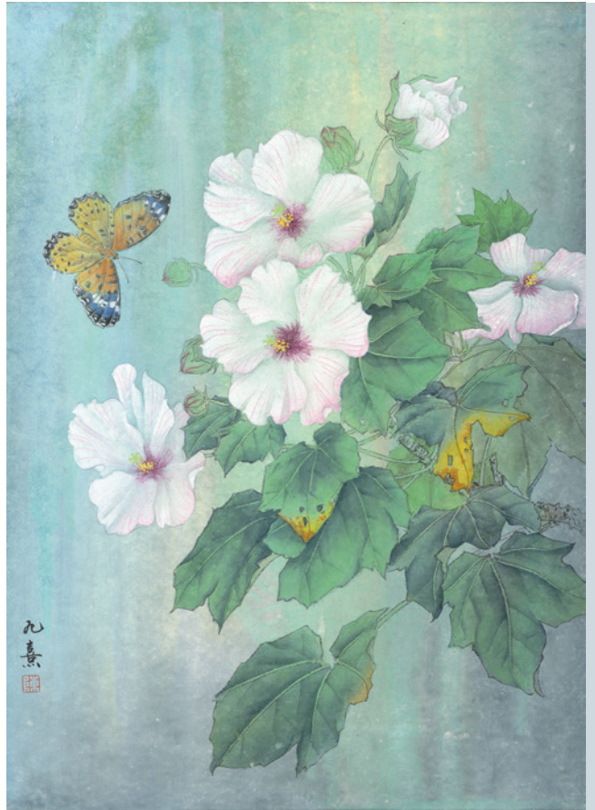
◎ 訳・慈願 絵・陳九熹