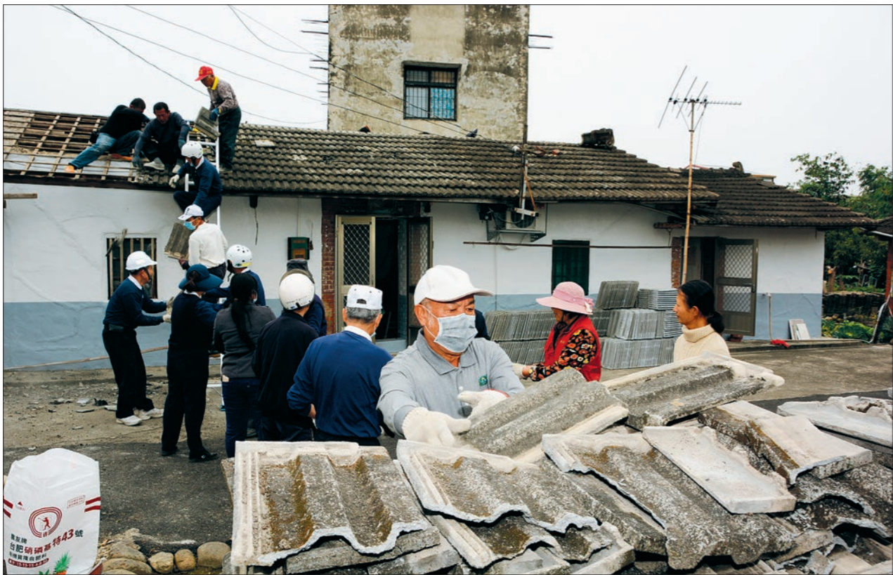
修繕工程歷時月餘，僅這一天就有二十二位志工來進行屋頂翻新工程。