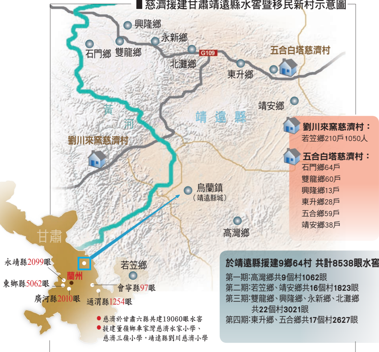
■ 慈濟援建甘肅靖遠縣水窖暨移民新村示意圖

黃土高原真的有可能透過治理而不再是黃土一片嗎？答案也許不會這麼快知道，但隨著環保意識的抬頭，政府到民間都有人努力著，要讓綠色重新降臨這塊土地上。十年、二十年後，小樹總有長成大樹的一天，也許我們能像當地人這樣期待著，黃土高原不再是黃澄澄一片，而是一望無際的翠綠草原。