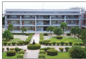
里港國中 1947年成立，學生870人 援建項目：教室21間 專科大樓、柔道拳擊館