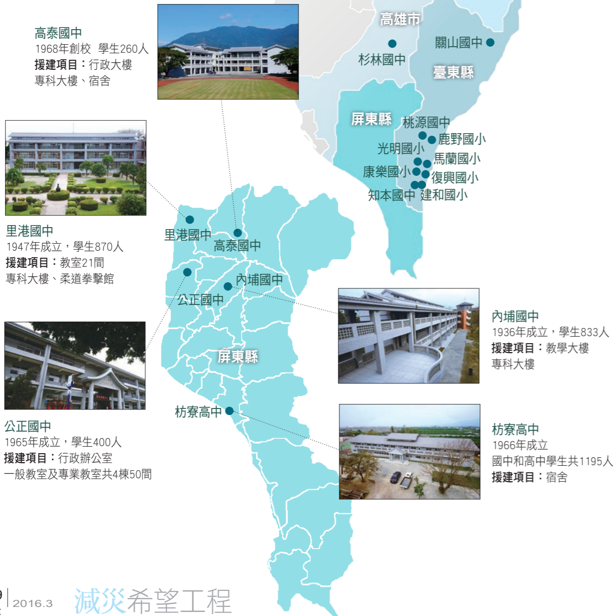
高泰國中 1968年創校 學生260人 援建項目：行政大樓 專科大樓、宿舍

臺灣九二一大地震後，慈濟援建51所希望工程。近年來全臺諸多老舊校園經政府評估安全堪慮；慈濟為學子安全考量，經與地方政府會勘並提列中央主管機關確認後整建，以推動校園「救災、減災、防災」機制，此即為「減災希望工程」。