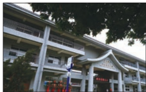
公正國中 1965年成立，學生400人 援建項目：行政辦公室 一般教室及專業教室共4棟50間