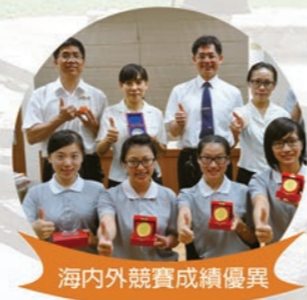
海內外競賽成績優異