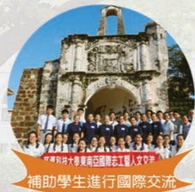
補助學生進行國際交流

地址：97005花蓮市建國路二段880號 招生專線：(03)8572158分機2728、2729 網址：www.tcust.edu.tw 傳真：(03)8578941、(03)8465770