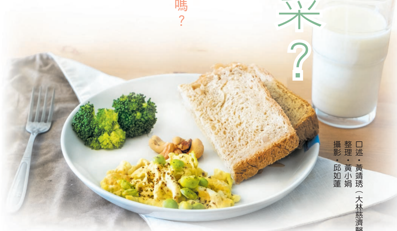
口述·黃靖琇（大林慈濟醫院營養師） 整理·黃小娟

A ：均衡健康素食是一種多色彩、多元化的飲食型態，例如主食，除了一般人認知的飯、麵、粥之外，還會鼓勵大家攝取不同的全穀根莖類植物，除了提供熱量，還含有各種維生素、礦物質、植化素