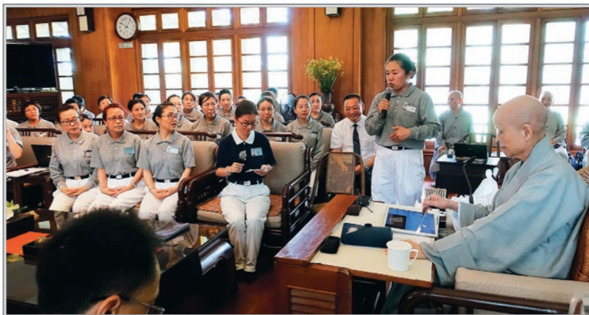
大陸東北地區志工分享會務及心得。上人勉眾用心「薰法香」，即使距離遙遠，師徒間彼此貼心無距離。（8月3日）

災難，但凝聚大愛能量，就能讓殘破城市恢復生機，甚至比過去更好。「人人方向一致，合和互協，社會就能欣欣向榮。」