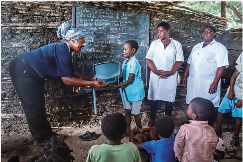
慈濟莫三比克聯絡處十一月一日捐贈恩佳小學教室座椅，讓師生能有更舒適的學習環境。

「唐代玄奘法師為了取經西行，在現代，你們也是取經傳法，要與當前的社會結合，讓慈濟用佛法走入社會，把四大志業建設起來。」