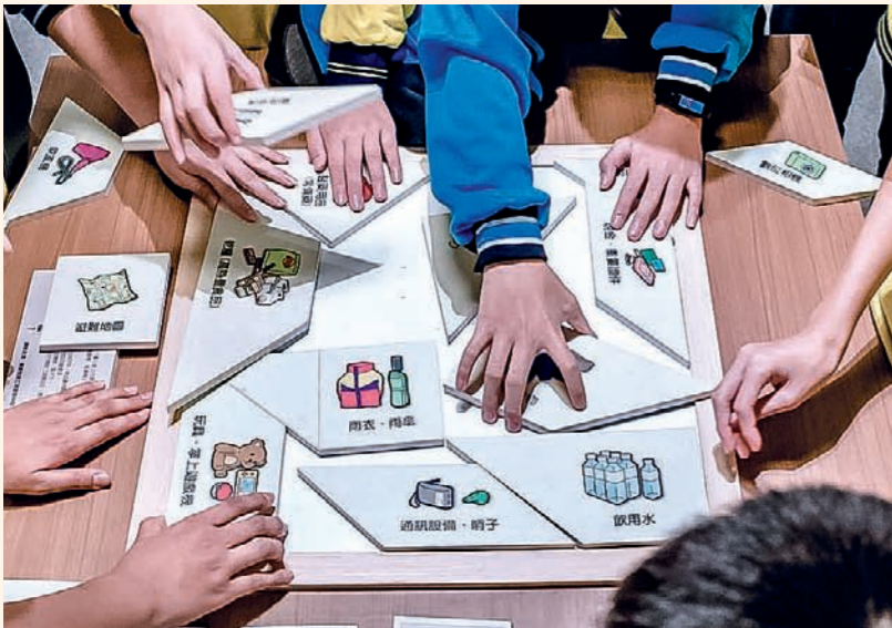
臺中靜思堂展館中，學生用七巧板桌遊拼出「緊急避難包」(上圖)；關渡環保防災教育展(下圖)以<u>K</u>讓人跟著海龜優游；環境教育可透過課程、戶外教學、參訪等方式進行。

燒了」這一關，同學們要猜猜看，誰才是溫室氣體排放的「大魔王」，究竟是牛羊豬雞鴨組成的畜牧業？還是運輸業的飛機汽車輪船？