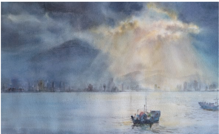
畫作·溫牧/那一道光

我非常感動，因為在加護病房，我沒能替病人做到的，心蓮病房團隊做到了！感謝同仁們讓愛陪伴到最後。（二〇二四年六月十五日志工早會分享）