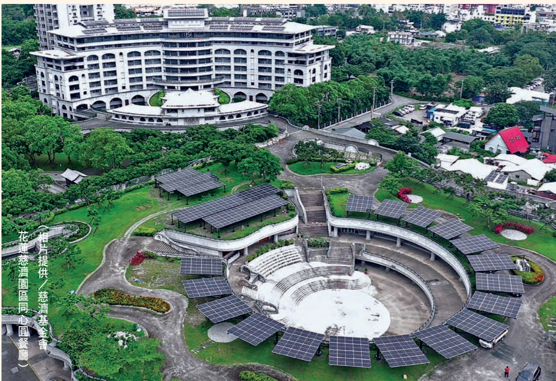
花蓮慈濟園區同心圓餐廳

慈濟現在已有三十四個會所可以分享到綠電，減少了向電力公司購買「灰電」所產生的排放。而另外十二個比較小型的太陽能案場，就採用「自發自建」模式，由慈濟出資建蓋，發出來