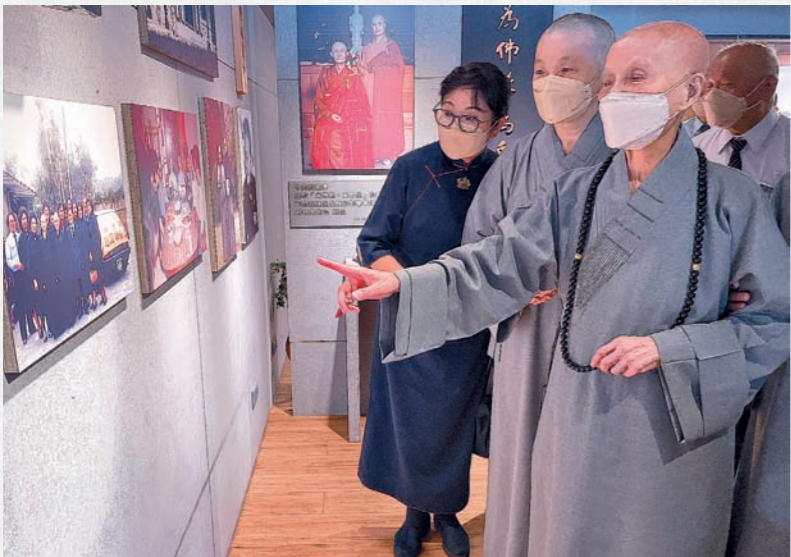
上人繞視臺中民權會所溯源館，瀏覽展出的慈濟史料。

「師父看到大家平時深入社區在做慈善，關懷貧病苦難，我很安心，也請你們要時常關心各社區道場，讓每一處社區道場都穩定運作，由當地慈濟人接引社區裏的人間菩薩，讓慈濟慧命不斷延續。大家都是師父的知音，很貼心地說師父要說的話，做師