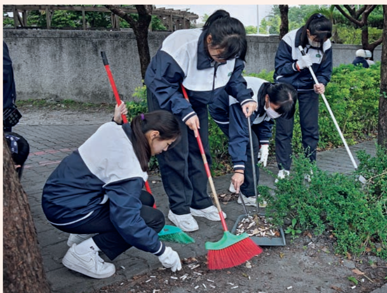
學生們整理鄰近校園的社區環境，以回饋在地的方式慶祝校慶。