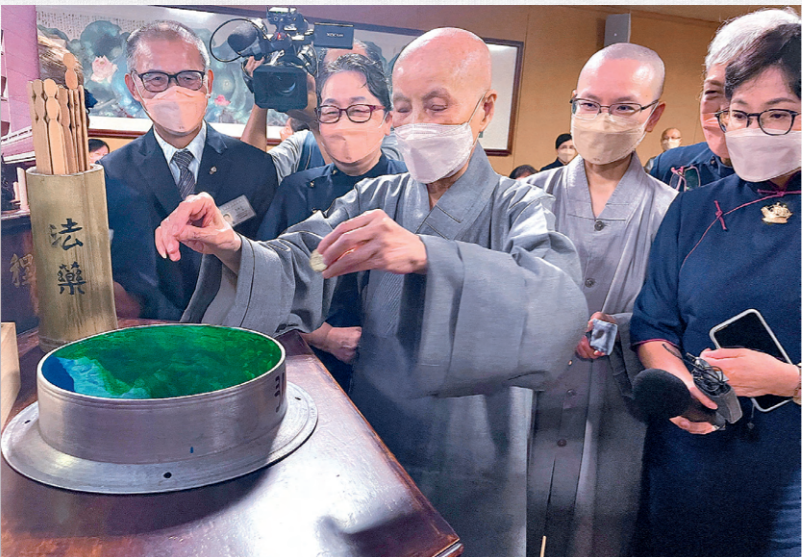
張煥奇師兄（左一）介紹苗栗歲末祝福法具，以中藥櫃結合古董鍋作為「鍋撲滿」，上人執起硬幣投入。