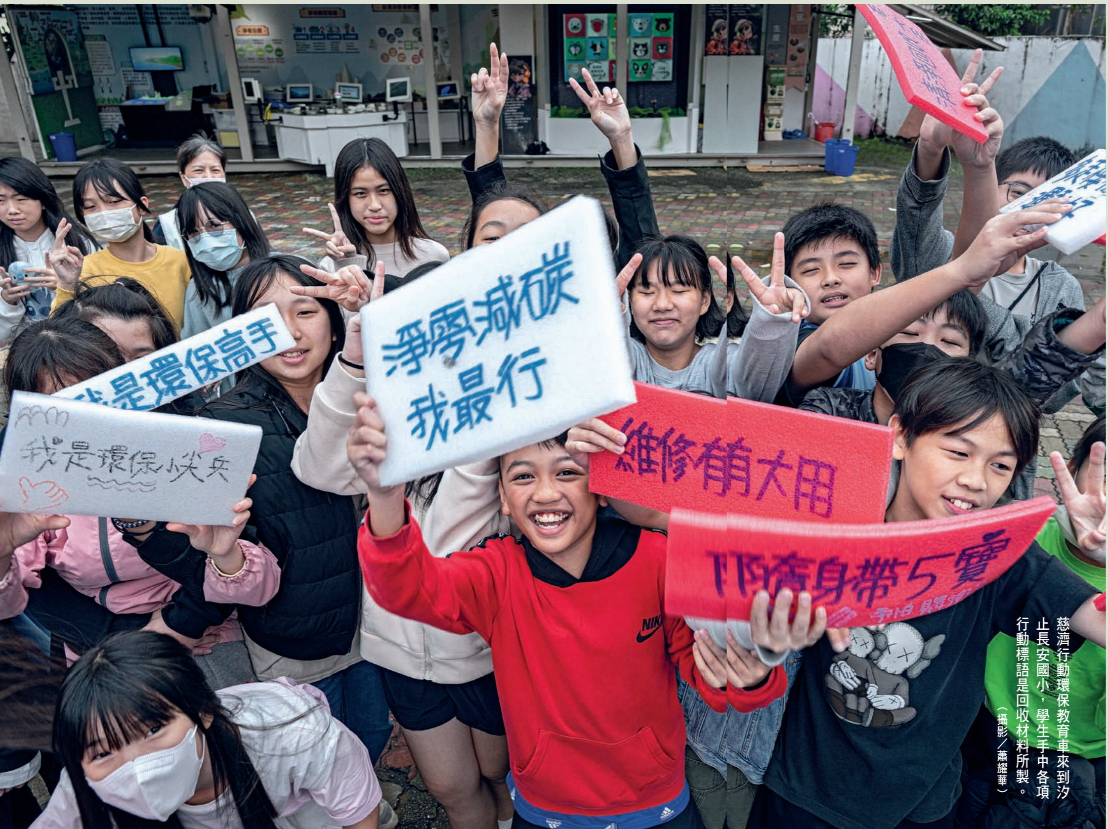
慈濟行動環保教育車來到汐止長安國小，學生手中各項行動標語是回收材料所製。

環境教育已成當代必修課，慈濟不只說說而已—— 三部行動環保教育車，二〇二五年上半年預約已滿，開放「候補」； 多間靜思堂正在申請「環境教育設施場所」的國家認證； 並廣邀學子們加入環保防災勇士C.A.S賽，第四屆熱烈展開中！