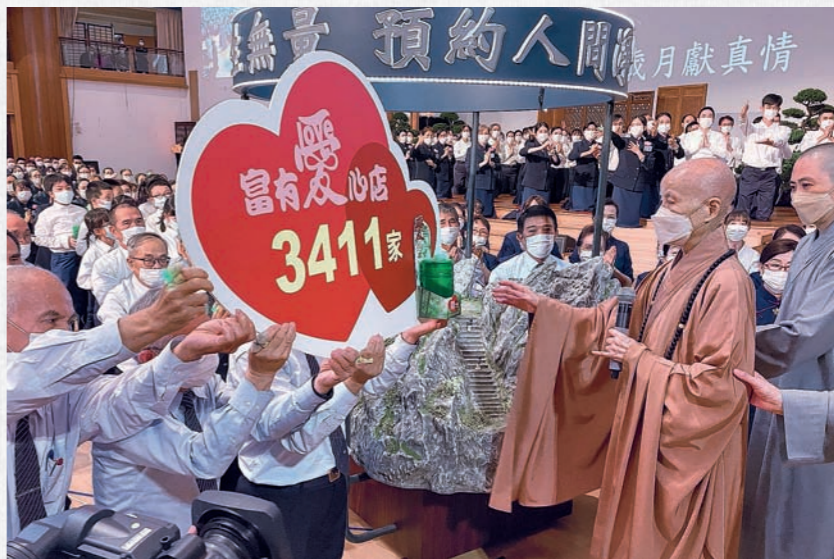
北區第七場歲末祝福暨授證典禮，慈濟人發願弘法利生，持續召募富有愛心店共同行善造福。（11月24日）