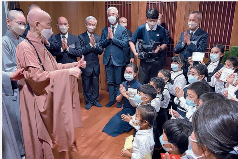
上人於桃園靜思堂主持歲末祝福暨授證典禮，小志工們向前問候。 (11月3日)

「慈濟的菩提林，就是將近六十年來，靠著慈濟人不斷在人間撒播種子，隨著時日，菩提苗從地生長，菩提根往下扎根。雖然此時遇到大風大雨，折損了樹體，但也要知道這是自然法則，把握當下，想得開、解得開，就沒有煩惱；但要記取教育、經驗，為了未來把周圍環境整理得更好；將我們的心境照顧好，外面的境界才能維護好。」