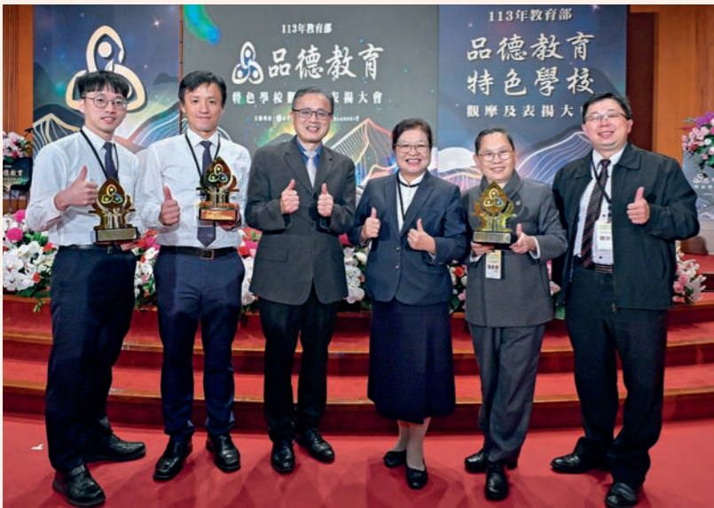
慈大附中首重多元發展與品德教育，二〇一八年高中部學生獲「iCC智慧鐵人創意競賽」冠軍（右圖）；二〇二四年小學至高中部獲頒教育部品德教育特色學校（左圖）。