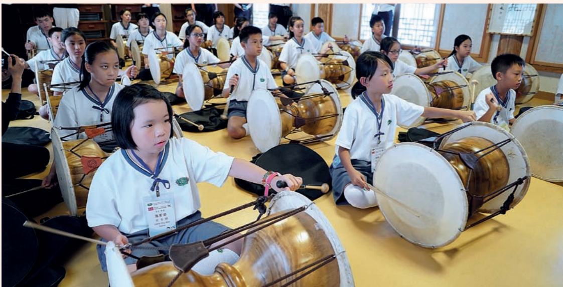
慈大附中學生在寒暑假自主報名修學旅行，二〇二四年七月，師生前往英國交流，與志工於倫敦街頭為街友發熱食。 二〇一七年七月，師生來到韓國臨泉書院學習傳統樂器。