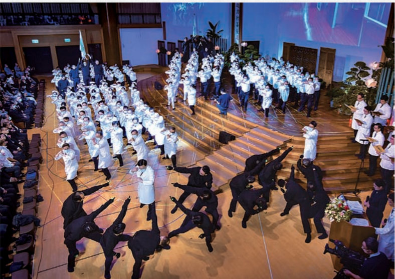
臺北慈濟醫院同仁十一月下旬歲末祝福，演繹《法華經》的火宅喻、醫子喻，及《無量義經·德行品》梵唄。