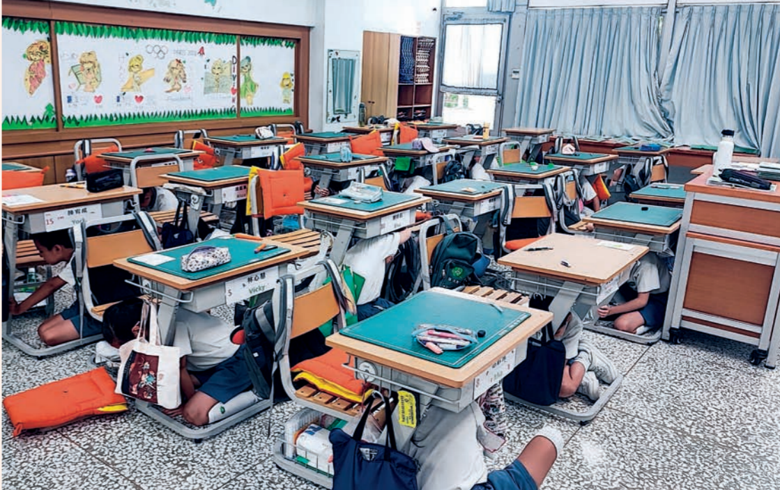
二〇二四年九月國家防災日避難演習警報響起，學生井然有序地就地掩護（右圖）並疏散（左圖）。