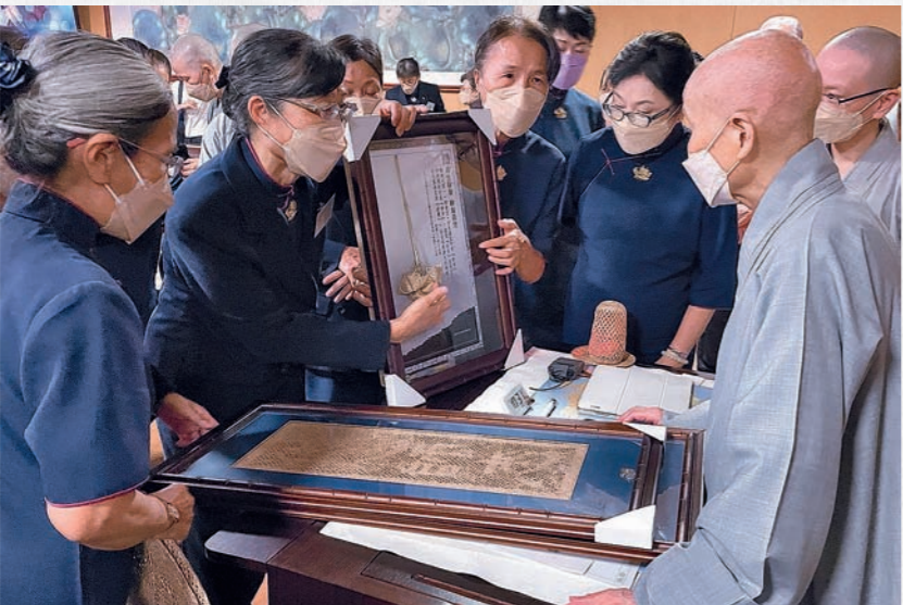
大甲蘭草團隊來到臺中靜思堂，展示蘭草手工藝品。 (11月7日)

回過頭來向導師叩頭，跪在他的面前。他就說：『你我師徒有緣，因緣特殊，你要入戒壇，我趕快為你寫一封信。』他入書房寫一封介紹信拿給我，因為當時超過十二點，要我趕緊回戒場，將介紹信拿給戒師，我就趕快再回借住的菩提講堂背起行囊去戒場。」