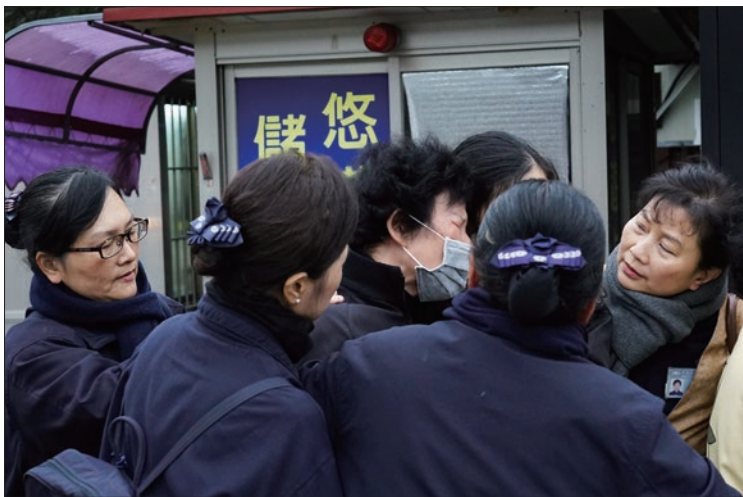
靈堂外，罹難者家屬悲傷難抑，志工趨前膚慰，靜靜陪伴在側。