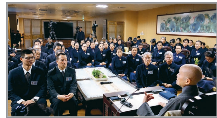
▼與中區志工幹部談話，上人勉眾要先淨化己心，如蓮花出淤泥而不染，以身作典範，才能接引更多人間菩薩。（1月26日）

「慈濟人不僅為天下人、天下事而擔憂，更起於行動付出；只要得知世間何處需要幫助，總是不辭辛勞前往救助。」上人舉非洲本土志工為例，雖然屬於「赤貧」的底層人口，但是同樣富有大愛，願意扶助比自己更困苦、貧病同胞，也為世界上需要救助的人付出心力。