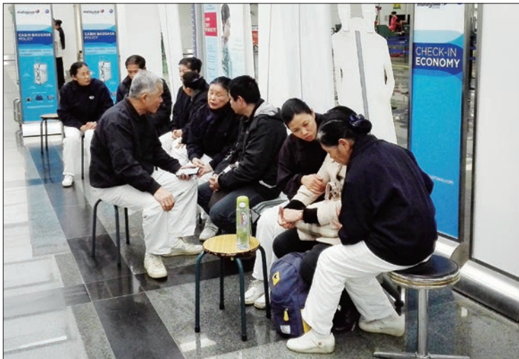
二月五日起大陸家屬分批來臺，第一個航班在上午十一點十五分起飛，志工八點半即來到廈門機場陪伴候機，連續多日提供安慰和物資補給。