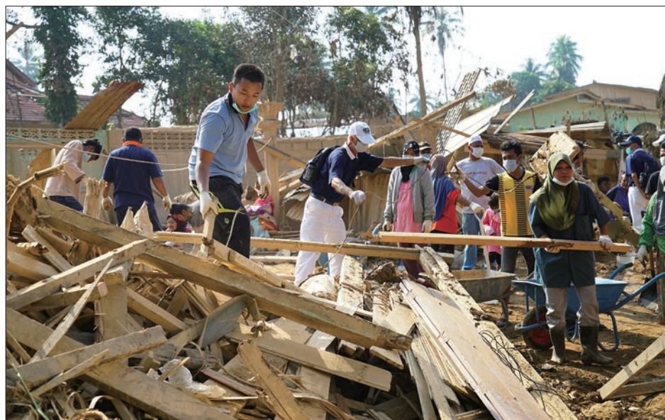
慈濟志工今年一月在瑪力勿萊村帶動兩梯次大規模以工代賑，村民熱烈響應，合力清除街道廢棄物與污泥。