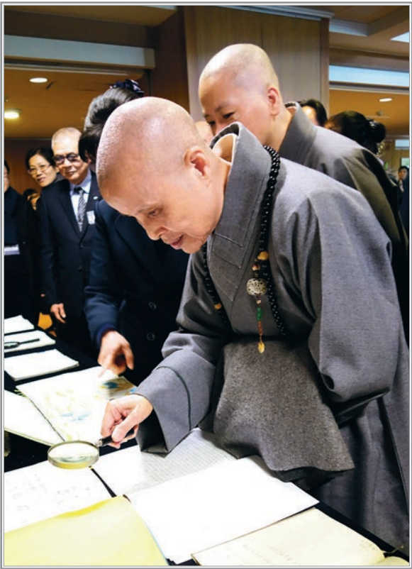
▲板橋志業園區展示志工們薰法香筆記，一本本字跡工整，密密麻麻記錄聞法心得。上人駐足閱覽後欣言，聽法且行法，有「覺」有「情」，就能在菩薩道上大步邁進。（1月18日）

時間不斷流逝，歲月催人老；起心動念、言行造作，也在歲月中累積善惡業。上人惕眾，造善因得善果、造惡因得惡果，「因緣成熟，業相就會現前。」 有些人會質疑，為什麼自己