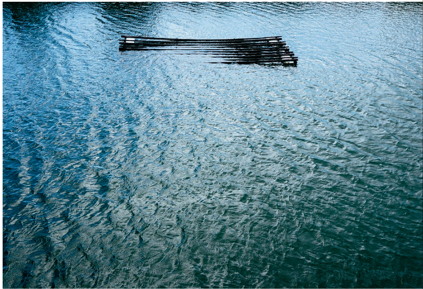
【沈浮之間】