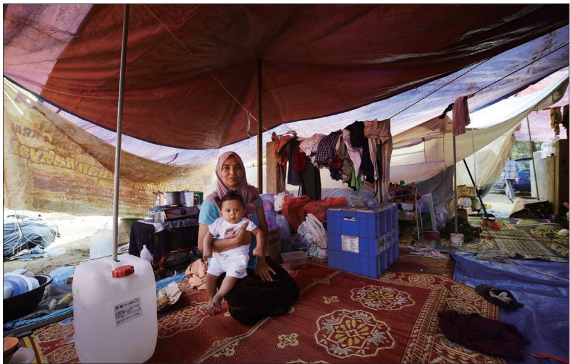
位於河畔的瑪力勿萊村每年雨季常遇淹水，然而此次水患宛如海嘯，全村盡毀。（攝影／顏文煌） 瑪力勿萊村村民就地取材搭起住處或是入住慈善團體捐贈的帳棚中，環境簡陋擁擠，夜間更是寒冷。（攝影／顏文煌）

一 月下旬勒比爾河（Sungai Lebir）河畔的瑪力勿萊村（Manik Manek Urai），灰藍的天空下，映入眼簾的並不是馬來人傳統的高腳屋，而是各式各樣帳棚林立。