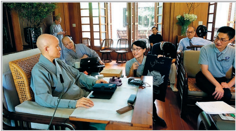
佛陀說法四十多年，到了晚