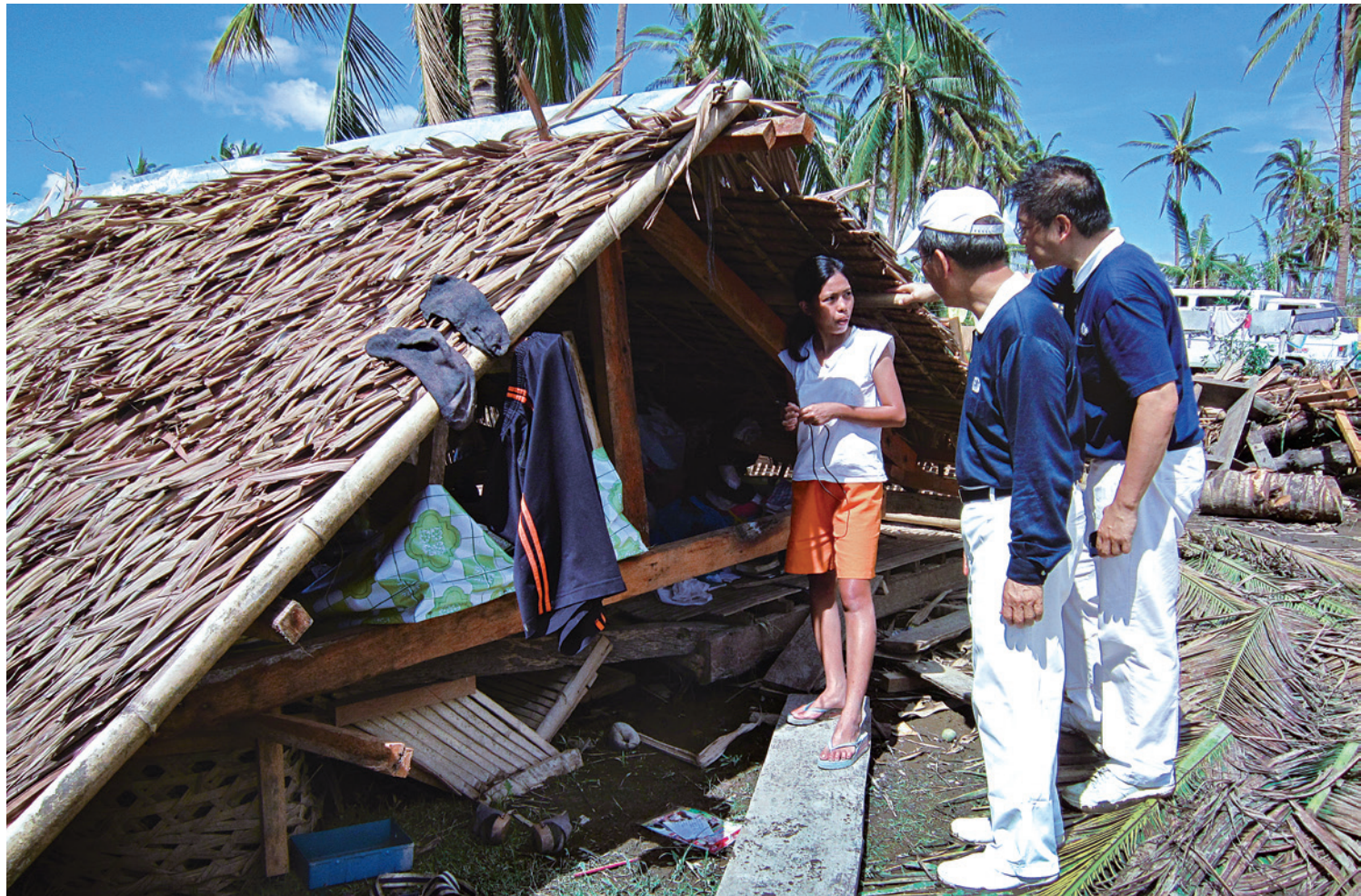
2013年、非常に強い台風30号がフィリピンに大きな被害をもたらした。慈済ボランティアは、甚大被災地レイテ島オルモック市の現地調査を行った。

のように温かく励まし、暗闇に光を照らすように、私たちに生活を立て直す勇氣と力を与えてくれた。