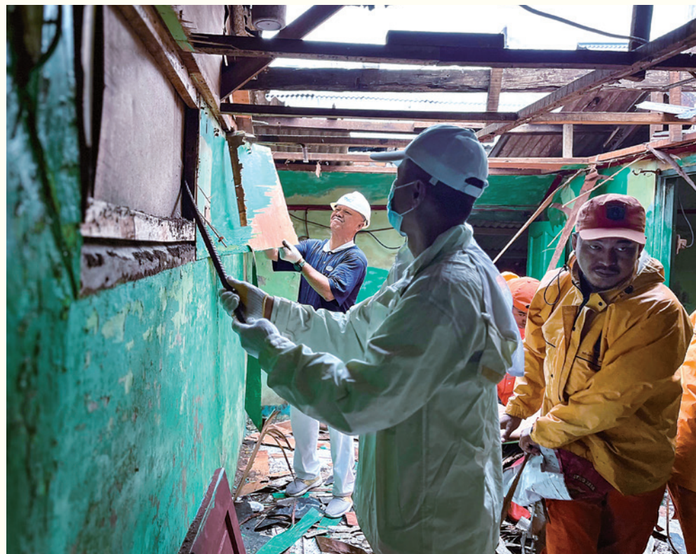
カマラ・ムアラ村第6期の住宅修繕計画は、2025年2月に始まり、慈濟ボランティアとインドネシア慈濟病院の職員、セダ・グループの社員、そしてアンダルシア看護専門学校の学生たちが解体作業を手伝っている。

ごとに施工状況は異なるが、中部ジャワ州バニユマス県を例に挙げると、村と村の間の距離が遠く、地形も起伏に富んでいるため、建設作業員は山を登ったり坂を下ったりしながら資材を運搬しなければならぬそうだ。