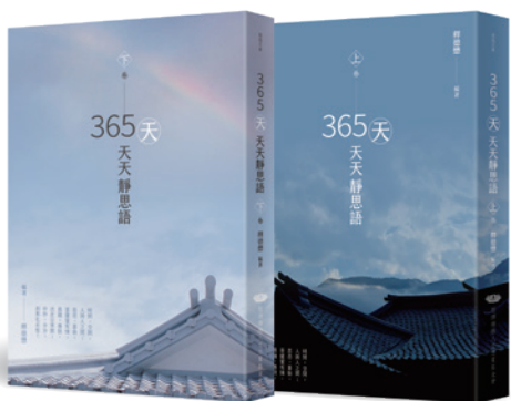
文と撮影・釈徳懋 訳・何慧純

證嚴法師の智慧の法語によって、私は修行の道での拠り所を見つけた。物事の進め方と人としての道を理解し、人との間における是々非々から逃れることができた。法語と法悦をもっとシェアすることで、誰もが心を開き、自在な人生を過ごせるようになってほしいと願っています。